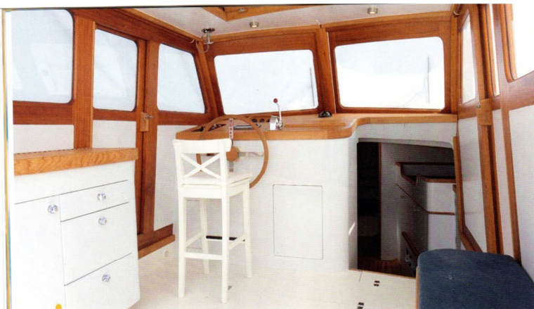
Licht en eenvoudig. In het stuurhuis van de Vedette vind je alleen het hoognodige waaronder een minimalistisch kombuisje aan bakboord dat je met de klep dicht niet eens als zodanig herkent.