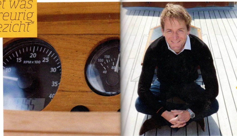
De vedette was van origine een open vissersboot uit Antibes. De boot werd gebouwd in de jaren dertig en later omgebouwd tot jacht. Nu is het een echte 'loungebboot'.